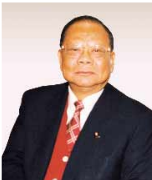
本集團主席 曾憲梓博士, 大紫荊勳賢