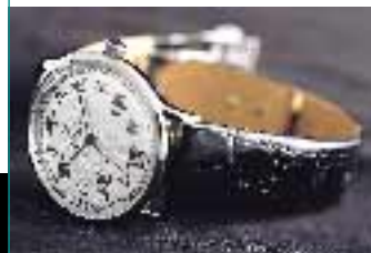
集團版權使用商之時尚 金利來品牌產品