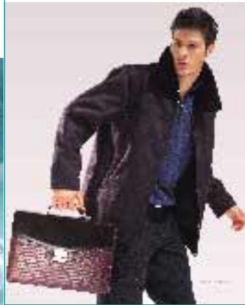
集團版權使用商之時尚 金利來品牌產品